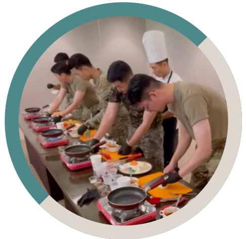
Korean Cooking Class