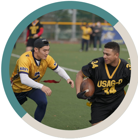
Army vs Navy Games

Sports, Fitness and Aquatics (SFA) helps our Soldiers and their Families stay fit while having fun throughout the year. From competitive events to recreational fun, USAG Daegu MWR offers something for everyone.