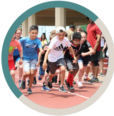
Lil' Murph Challenge